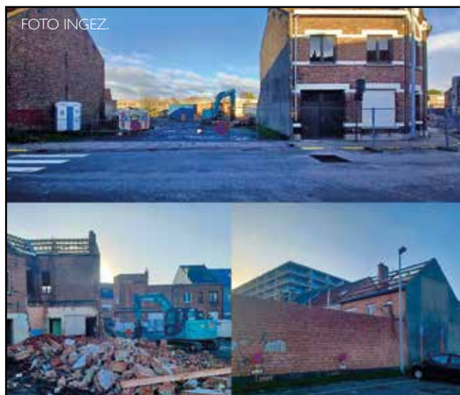
Verschillende huizen worden afgebroken om er een buurtparking te maken.

"Die woning is eveneens eigendom van de gemeente en is gelegen naast de parking", gaat burgemeester Mast verder. "Die woning deed tijdens de covid-periode dienst als testcentrum, maar staat sindsdien leeg. Als de woning wordt afgebroken, zal de parking daar worden uitgebreid." (jh)