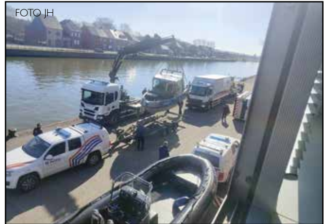
Een beeld dat zich nog even zal herhalen: de federale politie en Civiele Bescherming die met heel wat materiaal het Zeekanaal doorzoeken.

Er is nog geen verband gelegd met dossiers over vermiste personen. De federale politie zal de komende weken wel een persconferentie organiseren. Het is de bedoeling om dan cijfers te kunnen meegeven over deze zoekactie en over zoekacties van het voorbije jaar. De zoekacties gebeuren in verschillende deelfases uitstrekt van Vilvoorde over Grimbergen tot in Antwerpen op meerdere plaatsen. De sonarboot wordt daarbij eerst ingezet om hotspots in kaart te brengen, waarna duikers in actie komen per plaats." (jh)