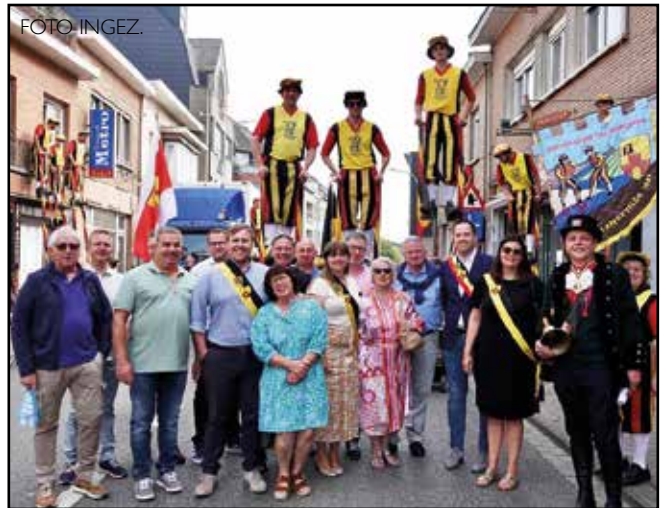
Het avondmarktcomité geeft de organisatie van het evenement door aan het gemeentebestuur.