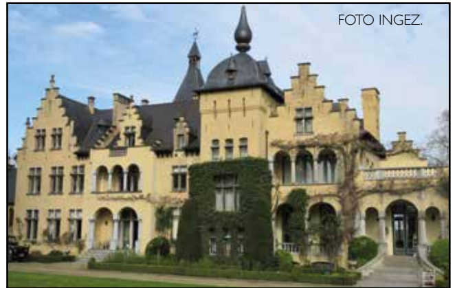
Het wandelparcours doet twee unieke kastelen in Ossel en Brussegem aan.