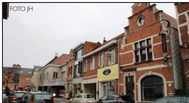
Rechts het opmerkelijke burgerhuis Den Dobbel Arend met de historische trapgevel.