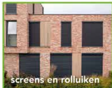
screens en rolluiken