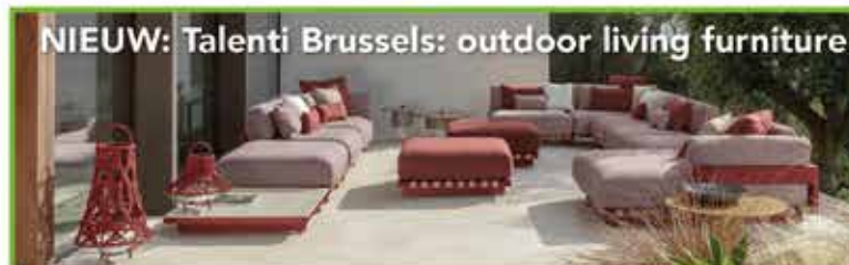
NIEUW: Talenti Brussels: outdoor living furniture