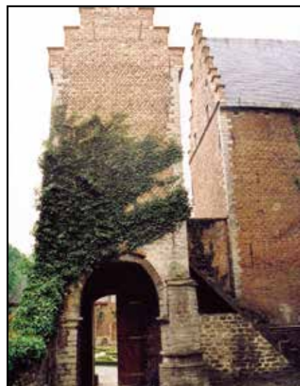
De kasteelhoeve wordt gered van vochtschade.