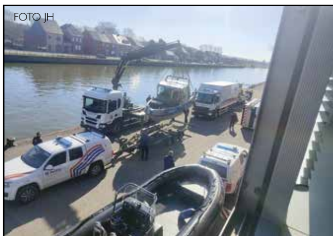
Een beeld dat zich nog even zal herhalen: de federale politie en Civiele Bescherming die met heel wat materiaal het Zeekanaal doorzoeken.

Er is nog geen verband gelegd met dossiers over vermiste personen. De federale politie zal de komende weken wel een persconferentie organiseren. Het is de bedoeling om dan cijfers te kunnen meegeven over deze zoekactie en over zoekacties van het voorbije jaar. De zoekacties gebeuren in verschillende deel-fases uitstrekt van Vilvoorde over Grimbergen tot in Antwerpen op meerdere plaatsen. De sonarboot wordt daarbij eerst ingezet om hotspots in kaart te brengen, waarna duikers in actie komen per plaats." (jh)