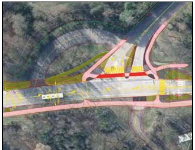
Een impressie over hoe het kruispunt wordt heringericht met afgescheiden fietspaden, nieuwe oversteekplaatsen en verkeerslicht.