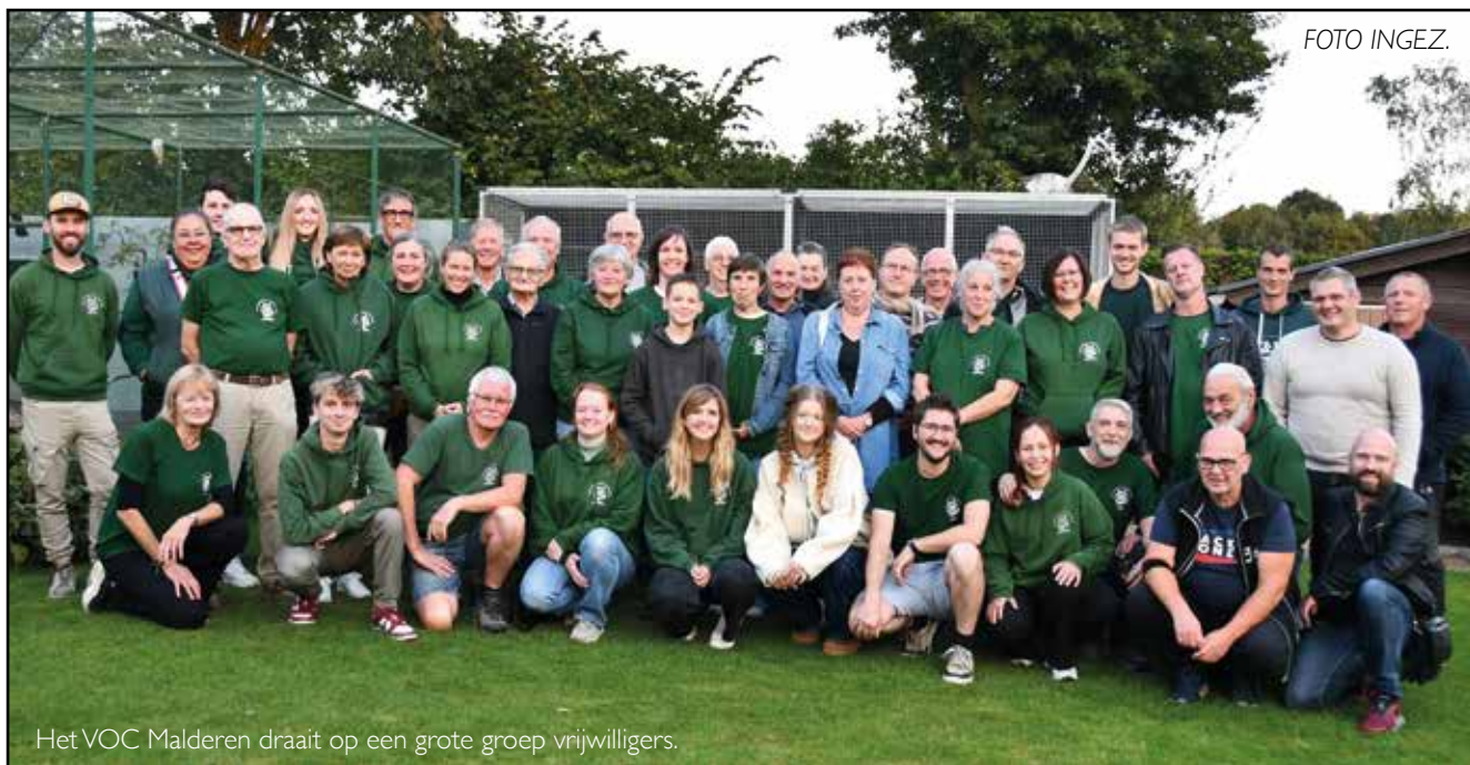
Het VOC Malderen draait op een grote groep vrijwilligers.

REGIO - Het Opvangcentrum voor Vogels en Wilde Dieren VOC Malderen -het enige in Vlaams-Brabant- lanceert een warme oproep om extra vrijwilligers aan te trekken. "De piekperiode komt eraan en dan is het alle hens aan dek om gewonde of zieke wilde dieren en vogels te verzorgen. We kunnen alle helpende handen gebruiken, er is een heel takenpakket te verdelen", klinkt het.