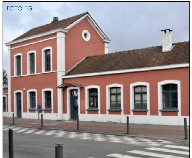
Het station van Opwijk

De politie van de AMOW-zone (Asse/Merchtem/Opwijk/Asse) trad het schepencollege bij. "In 2021 werden tien feiten opgehelderd op 21 aangiften van de slachtoffers", laat de politie weten. "Twee daders werden op heterdaad betrapt. Ze werden voorgeleid voor de onderzoeksrechter, die de hoofdverdachte in de cel opsloot en zijn kompaan vrijliet onder voorwaarden. Het duo bekende verschillende fietsdiefstallen in Opwijk. Tijdens huiszoeken werden gestolen fietsen teruggevonden, en op aangeven van de daders in de struikgewassen in de omgeving van het station gevonden. De gestolen fietsen werden verkocht via tweedehands.be en Marketplace op Facebook.