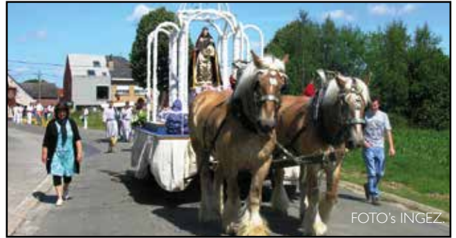
De processie is een mooie traditie in Steenhuffel.

Meer informatie vind je op www.genovevaprocessie.be of op de Facebookpagina van 'Sint-Genovevaprocessie Steenhuffel'.