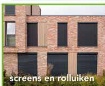
screens en rolluiken