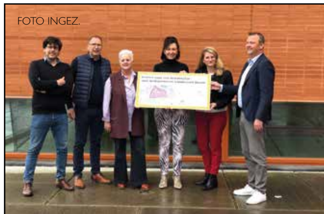
De gemeente denkt met alle partners mee over de toekomst van de Bedrijfzone Londerzeel Noord.

“Met de aanvullende subsidie van VLAIO (Agentschap Innoveren & Ondernemen) die we binnenhaalden, kunnen we een masterplan voor het gebied opmaken dat de basis legt voor een latere herinrichting van de volledige zone en voor een veilige ontsluiting ervan. We willen dat de aanwezige bedrijven zelf een cruciale rol gaan spelen in de opmaak van het plan. Als eindgebruikers hebben ze immers een directe invloed op hoe de ruimte wordt gebruikt. We willen tot collectieve oplossingen en samenwerking tussen bedrijven komen.