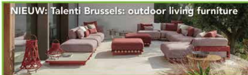
NIEUW: Talenti Brussels: outdoor living furniture