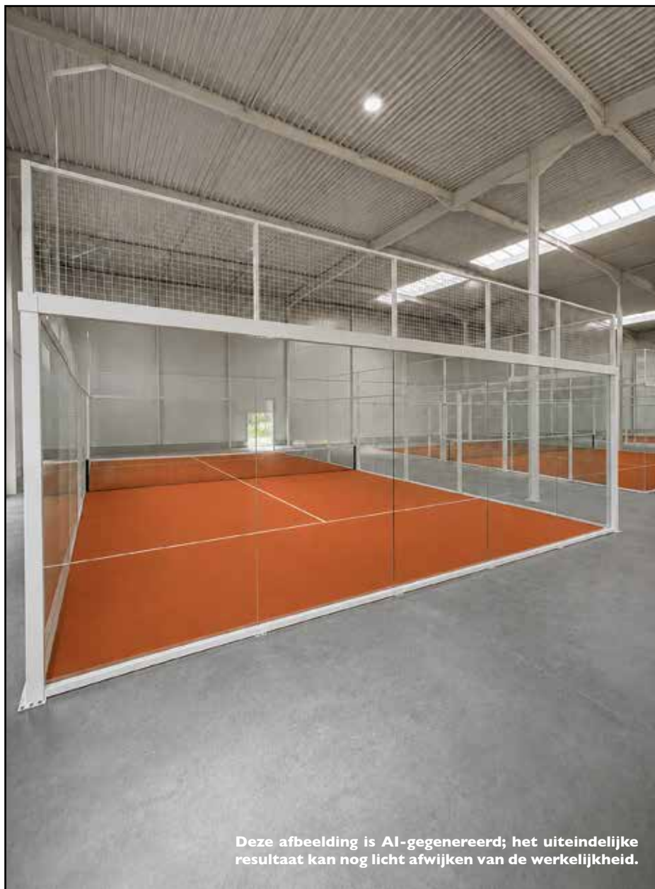
Deze afbeelding is AI-gegenereerd; het uiteindelijke resultaat kan nog licht afwijken van de werkelijkheid.

Als alles volgens planning verloopt, kunnen de eerste ballen in de nieuwe indoor padelhal al vanaf midden/eind juli worden geslagen.