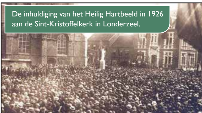
De inhuldiging van het Heilig Hartbeeld in 1926 aan de Sint-Kristoffelkerk in Londerzeel.