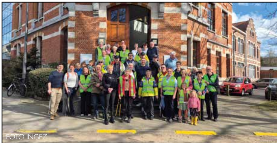
Heel wat inwoners helpen mee met de Grote Lenteschoonmaak.

GRIMBERGEN - Een kleine 100 Grimbergenaren, groot en klein, trokken handschoenen aan om vanaf een vast vertrekpunt hun buurt zwerfvuilvrij te maken.