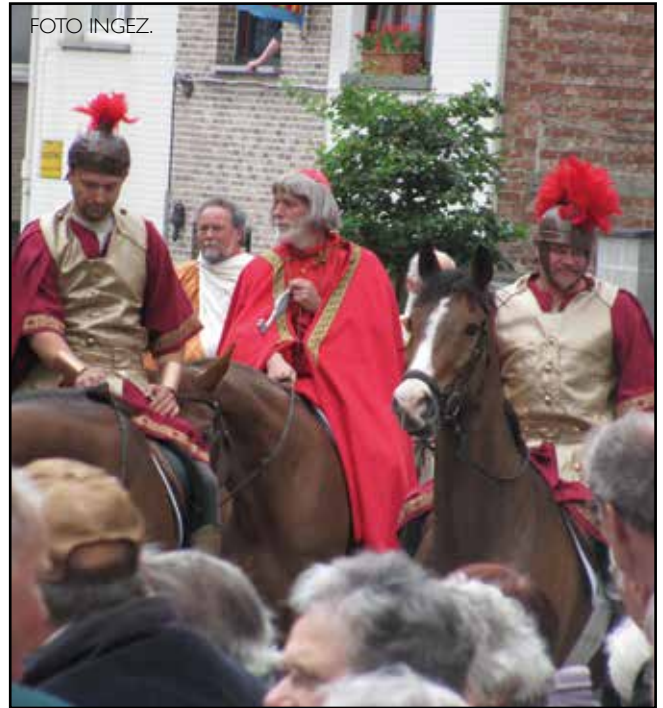
Er worden nog vele figuranten gezocht voor de Sint-Servaasommegang.