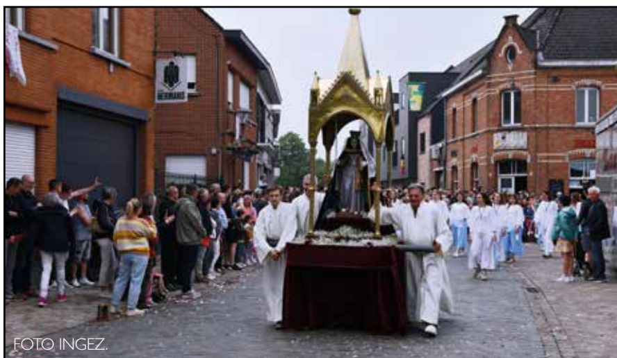
De Sint-Genovevaproces­sie vertrekt op zondag 8 juni om 10.30 uur aan de kerk.