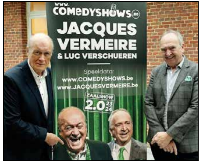
Jacques Vermeire en Luc Verschuieren stoppen op hun hoogtepunt met de allerlaatste Zaalshow 2.0.

REGIO - Het komische gekende dus Jacques Vermeire en Luc Verschuieren zijn bezig aan hun afscheidstournee met Zaalshow 2.0. Je kan hen in het CC Strombeek voor de allerlaatste keer aan het werk zien op woensdag 28 mei 2025. Eind de jaren tachtig maakte het publiek kennis met één van Vlaanderens meest iconische duo's. Luc Verschuieren en Jacques Vermeire toerden toen zeven jaar lang alsof hun leven ervan afhing. Tot 200 optredens per jaar, 1.150 in totaal in de periode 1989-1995, voor zo'n 550.000 uitzinnige fans. Het duo groeide uit tot een waar begrip in de comedywereld, maar het einde is nu stilaan in zicht: beide heren stoppen ermee en begonnen eind 2024 aan hun afscheidstournee met Zaalshow 2.0. "Ik heb met Luc een jaar de 'Zaalshow 2.0' gedaan voor volle zalen en we hebben samen besloten om er nog een seizoen bij te doen", laat Jacques Vermeire weten. "Nu ik ererurger ben van Keerbergen, hebben we besloten om een ereronde te doen van deze show. En daarna gaan we stoppen." Vanaf oktober 2024 werd het startschot gegeven van hun ereronde. Een laatste mogelijkheid om dit legendarisch duo live aan het werk te zien: "We hebben tegen elkaar gezegd dat we nog een jaar een laatste keer samen gaan optreden", zegt het komische duo. "Nog één seizoen en dan stoppen op een hoogtepunt, want ik vind oprecht dat ik nu m'n beste werk ooit lever. Straffer dan Zaalshow 2.0 kan niet. Dus als je ons nog eens wil zien, het is het moment.