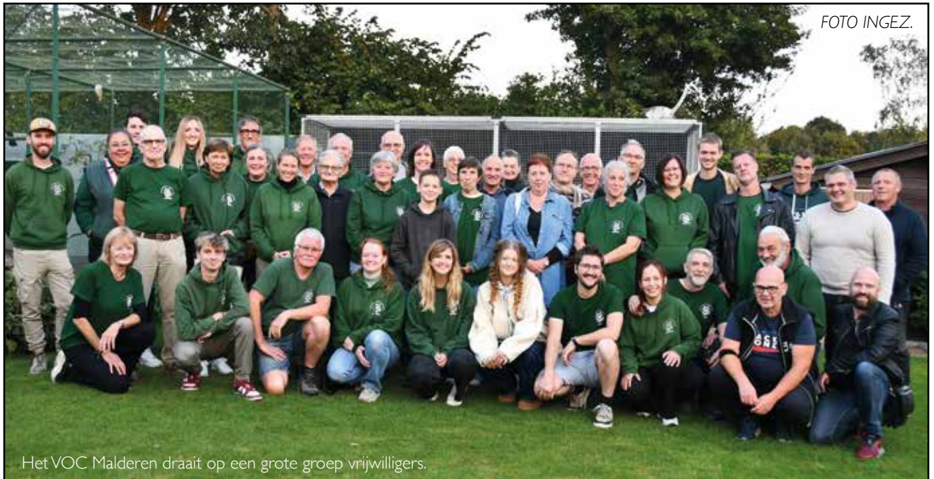
Het VOC Malderen draait op een grote groep vrijwilligers.

REGIO - Het Opvangcentrum voor Vogels en Wilde Dieren VOC Malderen -het enige in Vlaams-Brabant- lanceert een warme oproep om extra vrijwilligers aan te trekken. "De piekperiode komt eraan en dan is het alle hens aan dek om gewonde of zieke wilde dieren en vogels te verzorgen. We kunnen alle helpende handen gebruiken, er is een heel takenpakket te verdelen", klinkt het.