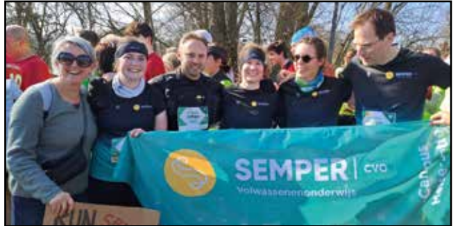
CVO Semper zet zich ook dit jaar in voor Kom op tegen Kanker.

We bedanken alle supporters en sponsors die deze acties mogelijk maken. Samen blijven we in beweging voor een toekomst zonder kanker." (jh)