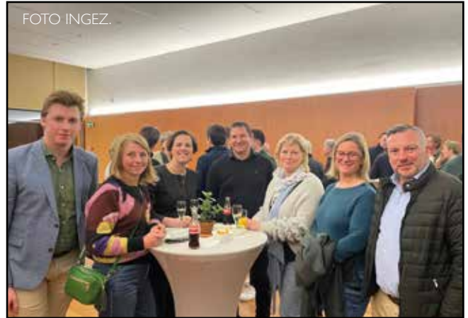
Samen met de middenstand van de handelskernen van Meise en Wolvertem krijgt het detailhandelsplan vorm.