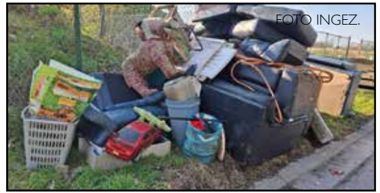
De sluikestorters moeten met een grote bestelwagen of vrachtwagen gekomen zijn om deze afvalberg te dumpen op 50 meter van de ingang van het recyclagepark.

LONDERZEEL - Vorige maand werd er een gigantisch sluikestort gedumpt vlak aan de ingang van het recyclagepark van Londerzeel. Op sociale media regende het intussen verbouwereerde reacties en burgemeester Nadia Sminate (N-VA) belooft in te grijpen met "haast onzichtbare" camera's om sluikestorters te vatten. De foto's spreken voor zich: haast een hele inboedel is afgelopen weekend op 50 meter van de ingang van het recyclagepark gedumpt. Het gaat om zetels, kasten, volle afvalzakken, textiel, kinderspeelgoed, noem maar op. Op Facebook reageren inwoners woedend. Burgemeester Nadia Sminate (N-VA) las de reacties ook en reageert op het voorval. "Dit moet echt stoppen", zegt Sminate. "De legislatuur is pas begonnen, maar we maakten van de aanpak van sluikestorten sowieso een prioriteit. Afvalintercommunale Incovo heeft wel mobiele camera's om sluikestorters te betrappen, maar die zijn heel zichtbaar en zijn bovendien voorzien van een draad voor de stroomvoorziening. Sluikestorters zien die camera's en kiezen dan gewoon een andere plaats. Wij hebben nu verschillende offertes gevraagd voor de aankoop van twee mobiele camera's die heel compact en dus haast onzichtbaar zijn.