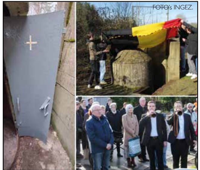
Tijdens een officiële plechtigheid werd de nieuwe bunkerdeur ingehuldigd.